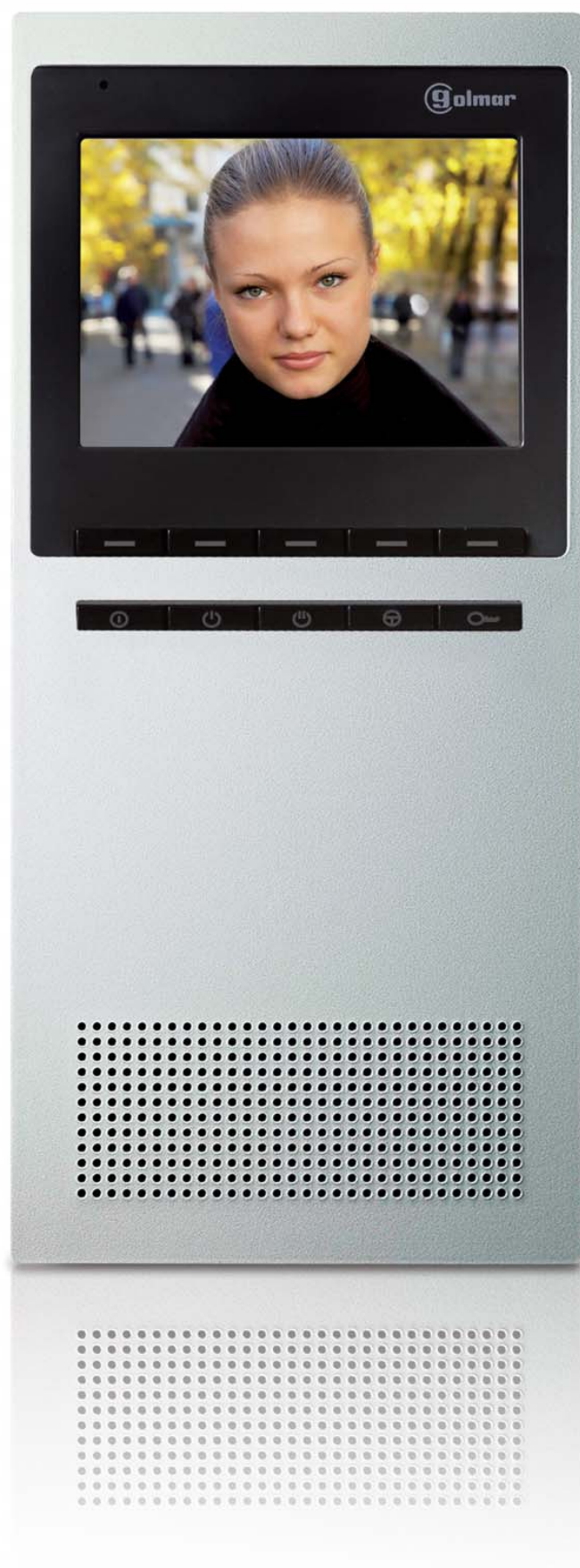
Skutočná veľkosť monitora